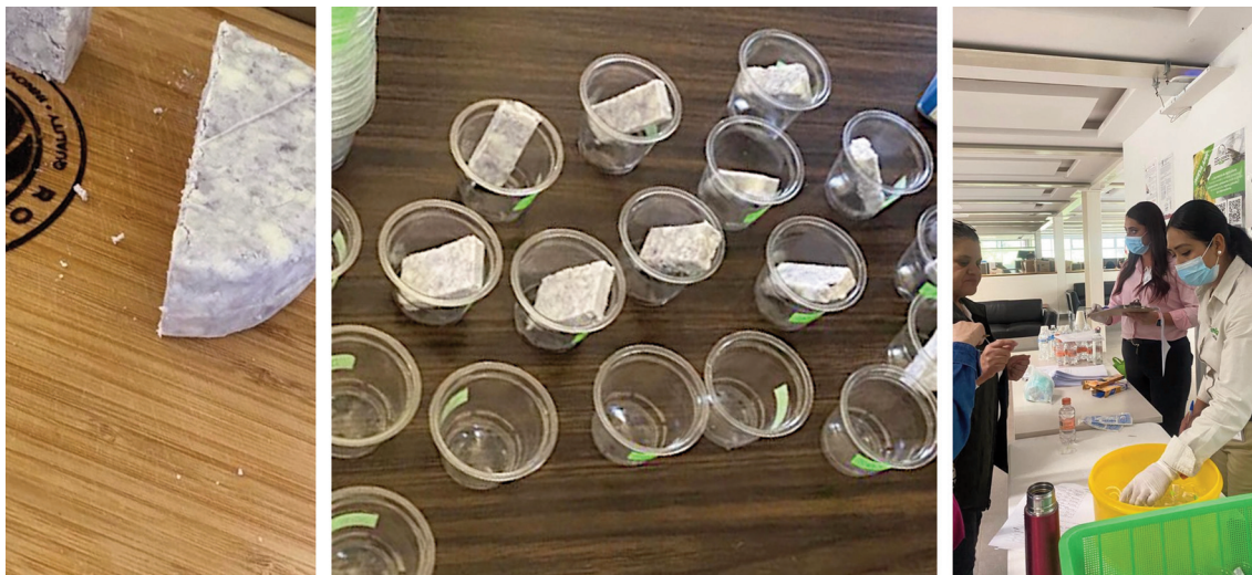
Figura 1. Muestras de quesos funcionales en el proceso de evaluación sensorial. Figure 1. Functional cheese samples in the sensory evaluation process.

La evaluación sensorial se generó para que el consumidor se familiarizara con el producto a evaluar y así, sus respuestas dentro del Proceso Analítico Jerárquico (AHP) tuvieran una mayor fundamentación.